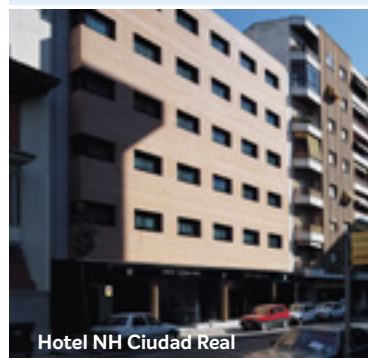
Hotel NH Ciudad Real

El hotel NH Ciudad Real está muy bien situado, a poca distancia andando de los lugares de mayor interés de la ciudad, una iglesia gótica del siglo XIII y el Museo del Quijote entre otros. Muy cerca del hotel encontrarás concurridas zonas comerciales, magníficos restaurantes y el parque más antiguo de la ciudad. El hotel tiene 90 habitaciones, cómodas y perfectamente equipadas. Están decoradas en estilo moderno, con suelo de madera y un escritorio grande para trabajar. También disponen de Wifi gratis, televisión vía satélite y aire acondicionado.