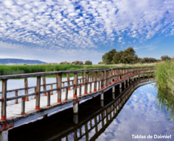
Tablas de Daimiel

escribir su genial obra literaria “Don Quijote de La Mancha”. Posteriormente nos dirigiremos a las Lagunas de Ruidera donde podremos contemplar el humedal más bello de la Península Ibérica.