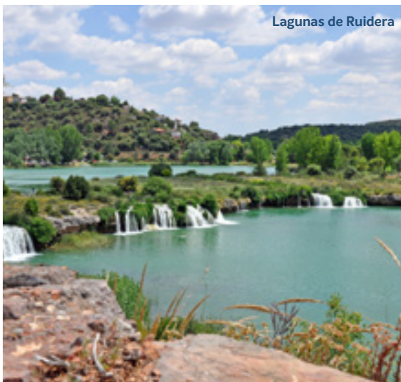
Lagunas de Ruidera

Desayuno en el hotel y salida para realizar una visita de medio día a las Tablas de Daimiel (visita guiada incluida) . Podremos disfrutar de una espectacular reserva natural y contemplar su fauna y flora. Visitaremos también el Molino de Molemocho. Regreso al hotel para el almuerzo . Por la tarde visita de Ciudad Real acompañados de guía oficial . Se extiende en el Campo de Calatrava enseñoreando su condición típicamente manchega, quijotesca y cristiana.