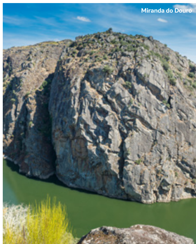
Miranda do Douro

Desayuno en el hotel y salida a las 7 de la mañana (salvo indicación contraria por parte del asistente en destino) hacia el punto de origen. Breves paradas en ruta (almuerzo no incluido). Llegada y fin de nuestros servicios.