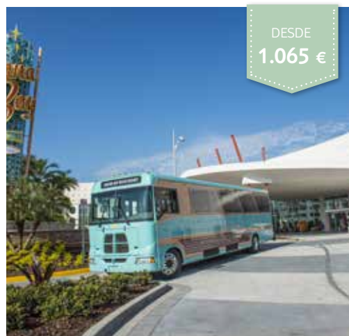
UNIVERSAL'S CABANA BAY BEACH RESORT™

TURISTA SUP. Solo alojamiento Standard 2 Queen