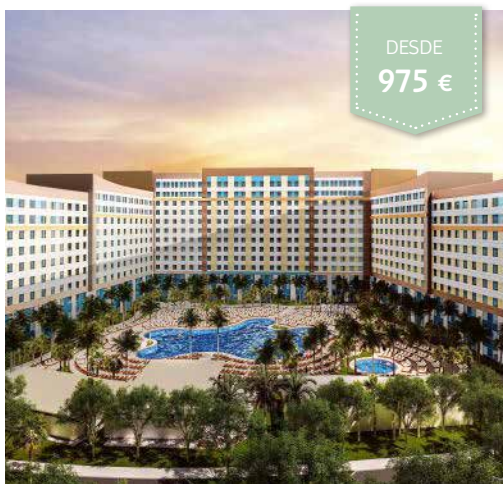
UNIVERSAL'S ENDLESS SUMMER RESORT - DOCKSIDE INN & SUITES™

TURISTA SUP. Solo alojamiento Standard 2 Queen