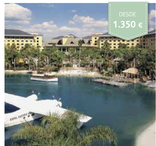
UNIVERSAL'S LOEWS ROYAL PACIFIC RESORT™

TURISTA SUP. Solo alojamiento Standard 2 Queen